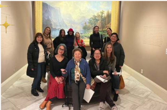
El paseo por SAAM + NPG fue una visita fascinante para este grupo de apasionad@s profesionales y entusiastas del arte, inmersos en un mar de conocimiento e inspiración.