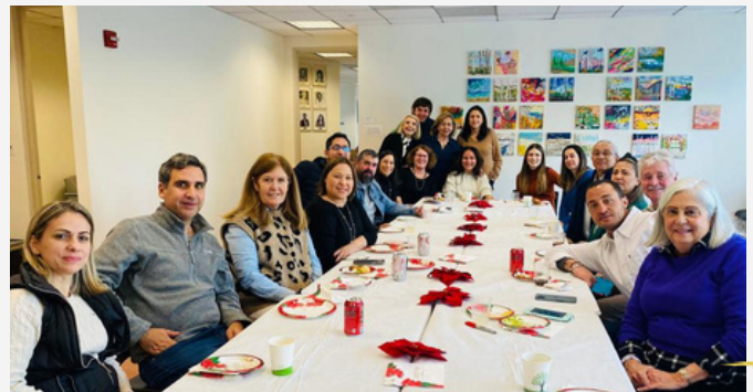
Un almuerzo especial cierra el año para l@s estudiantes de inglés, marcado por risas, intercambio de experiencias y platos deliciosos que reflejan la diversidad de la clase.