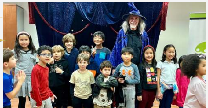
Una celebración de fin de año con l@s nin@s. Un mago encantó a l@s invitad@s con trucos fascinantes, mientras alrededor, las sonrisas iluminan los rostros de tod@s.

En este año 2023, nosotr@s, en la Asociación de Familias, tuvimos el honor de ofrecerles a ustedes, nuestr@s miembr@s, oportunidades únicas para fortalecer lazos, aprender, hacer amistades y compartir experiencias. Esperamos que en 2024 sigamos unidos y con un calendario lleno de nuevas actividades.