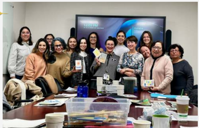
Esta imagen resume el éxito del taller de acuarela, donde este grupo de artistas se reunieron para inspirar y ser inspirad@s. Las pinceladas de creatividad y pasión colmaron el ambiente.