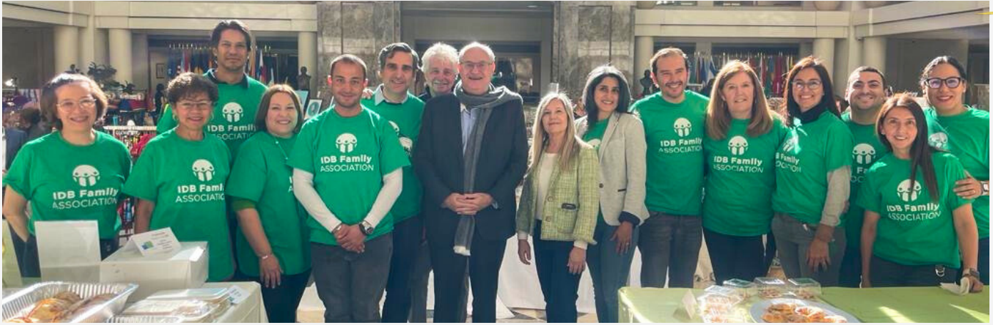
Junto al presidente del IDB Ilan Goldfjan, algunos de l@s voluntari@s que hicieron realidad el Bazaar 2023. Esta foto captura el espíritu de compromiso. ¡Muchas gracias!