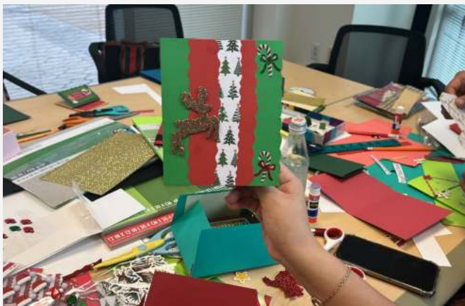
El taller de tarjetas navideñas fue una invitación a la creatividad, donde cada doblez y brillo fueron expresiones de cariño para celebrar la magia de la temporada festiva.