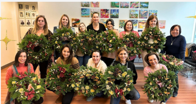
El taller de corona navideñas. Sensibilidad, intercambio de ideas y la emoción de dar vida a estas coronas hicieron de este taller un encuentro muy ameno.