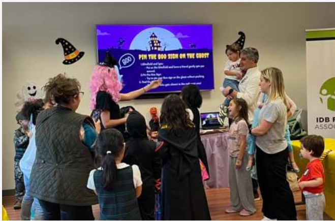
Tuvimos un Spooktacular evento de Halloween en octubre donde l@s nin@s jugaron, bailaron y crearon junt@s. Una bonita oportunidad para hacer nuev@s amig@s.