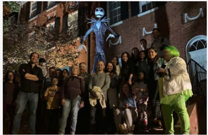
Entre historias de fantasmas y misterios, Halloween reveló su magia mientras explorábamos lo desconocido por las calles de Georgetown durante el Ghost Tour.