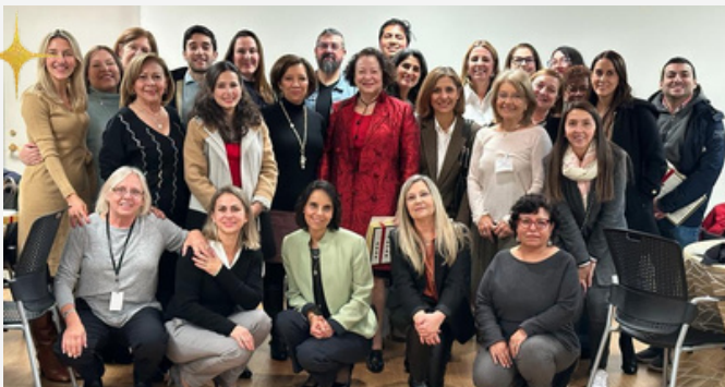
Almuerzo de agradecimiento a l@s voluntari@s. Un tributo al compromiso de quienes fueron el impulso detrás de la Asociación en 2023. ¡Gracias!